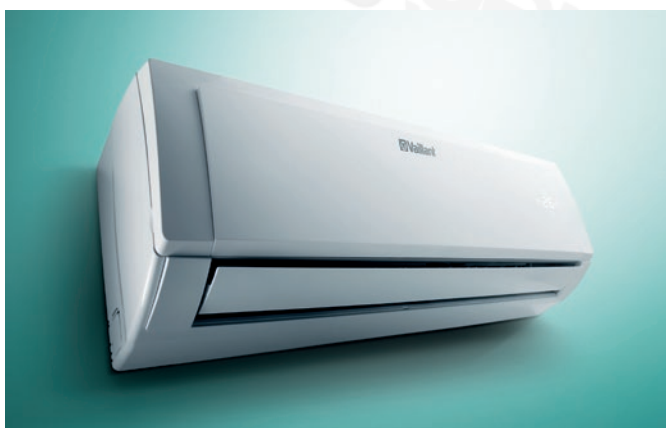
climaVAIR exclusive beltéri egység