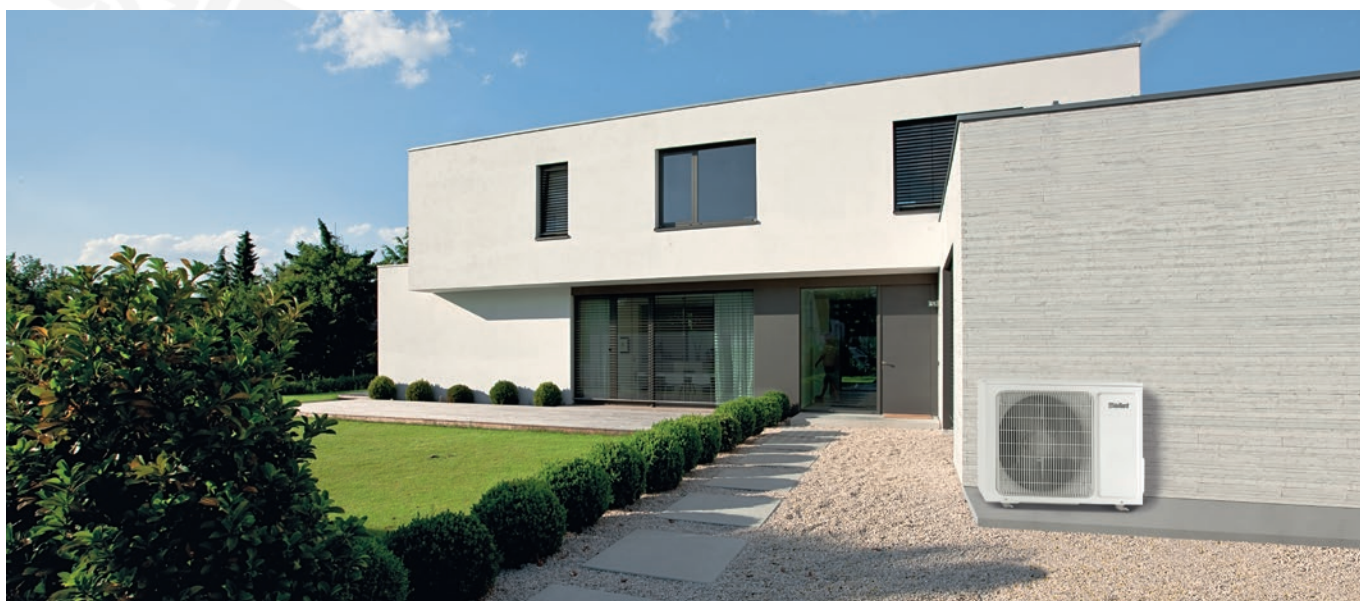
climaVAIR exclusive kültéri egység