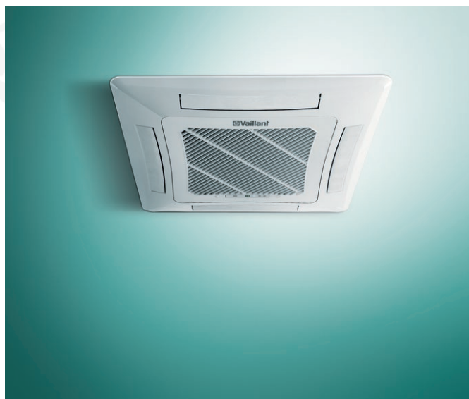
Kazettás beltéri egység