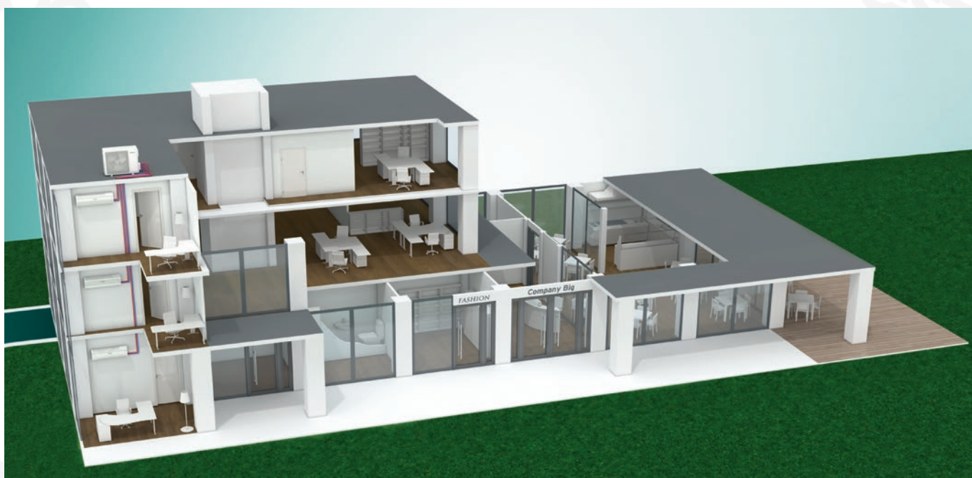
A multisplit telepítés felhasználási lehetősége: egyetlen kültéri egység három beltéri egységgel

climaVAIR exclusive légkondicionáló készülékeink egész évben optimális lakótér komfortot garantálnak. A modern inverter technológia és így a moduláló működés energiatakarékos üzemeltetést tesz lehetővé, jelentős hőmérséklet-ingadozások nélkül.