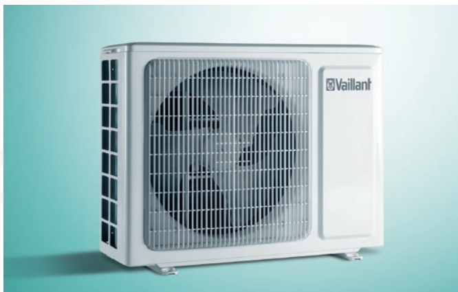
climaVAIR exclusive kültéri egység

A beltéri egység (VAI 5-025) zajszintje 24 dB(A) a ventilátor legalacsonyabb fordulatszám mellett.