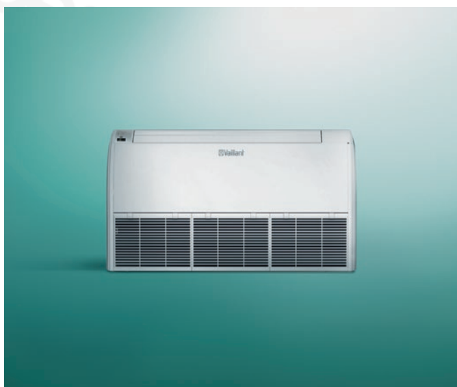
Konzolos beltéri egység