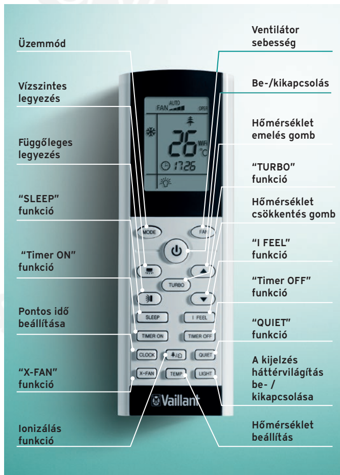
climaVAIR exclusive vezeték nélküli távvezérlő