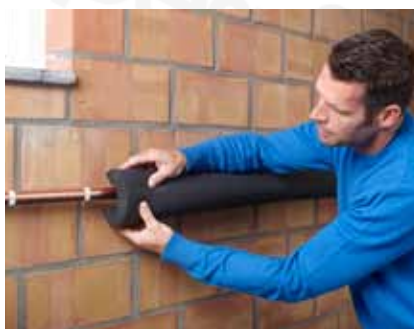
Lássa el hőszigeteléssel a csövet és a fűtőkábelt.